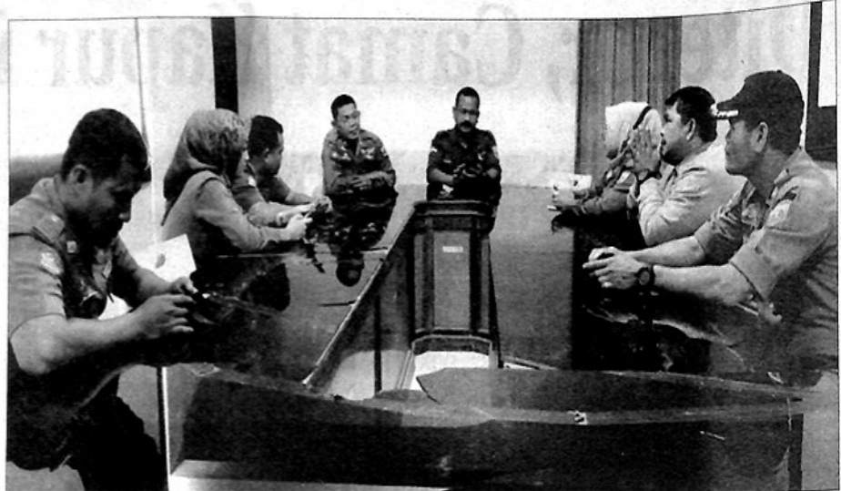
KOORDINASI: Tiga OPD di Padangpanjang bersinergi untuk meningkatkan ketentraman dan ketertiban umum di pasar, Selasa (18/10) kemarin.

"Terutama setiap hari pekan (Senin dan Jumat), pihaknya bergabung dengan Pol PP Damkar dan Perdakop UKM apabila memang dibutuhkan dalam penyelenggaraan trantibum dan kenyamanan di sekitar Pasar Pusat sesuai dengan tupoksinya di bidang lalu lintas," sebut Andhika terpisah. (wrd)