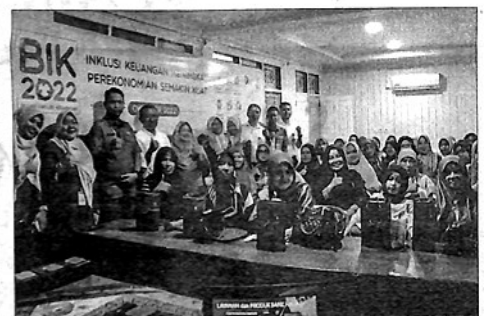
SOSIALISASI Badan Inklusi Keuangan bagi pelaku UMKM yang difasilitasi Bank Nagari.

"Ada lagi promo lainnya yaitu pembelian kendaraan bermotor baik baru maupun bekas, dengan bunga 0,6 persen dengan jangka waktu 5 tahun untuk mobil dan 4 tahun untuk motor," sebutnya. (ned)