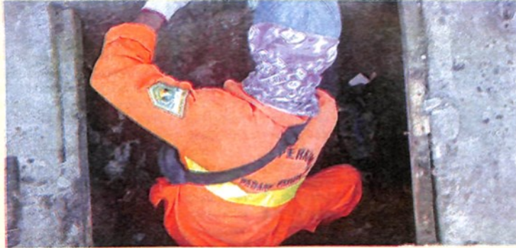
SALAH seorang petugas kebersihan melakukan pembersihan gorong-gorong dari sampah.

"Hari ini (Kemarin-red) kita menurunkan kurang lebih 72 petugas gabungan yang nantinya akan melakukan pembersihan lokasi Pasar Pusat dan Pasar Lingkar (pasar sayur lama). Yang akan